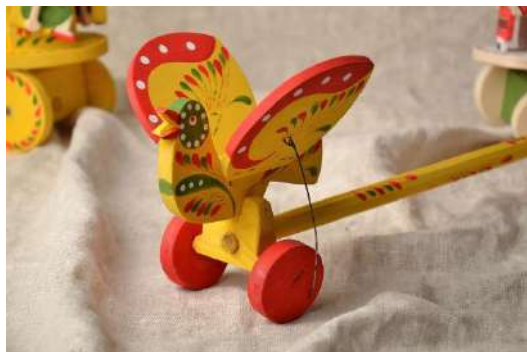
Рис.1 – Образец игрушки «Птица»

Образец: Модель динамической игрушки «Птица»